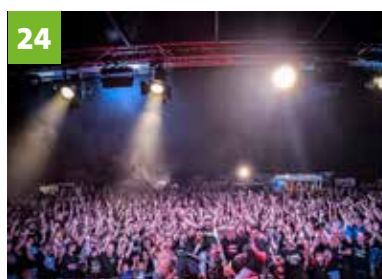
Rock Sommer Nacht