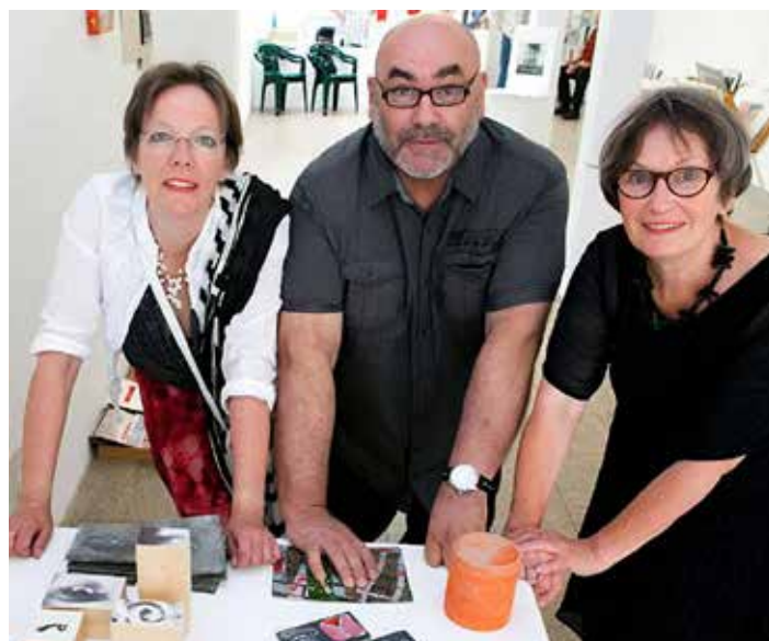
Die Mitglieder der Galerie Judith Dielämmer im Jahr 2022 auf der Apfelwiese