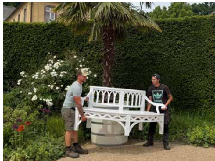
Die Freiwilligen helfen bei Arbeiten im Schlosspark

In der Kultur unterstützen die Freiwilligen die kulturpädagogische Arbeit, etwa bei Kindergeburtstagen und Kinderpro-