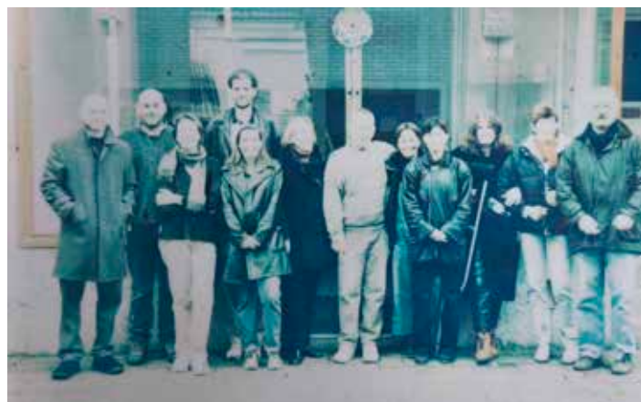
Ein vergilbtes Foto aus dem Gründungsjahr