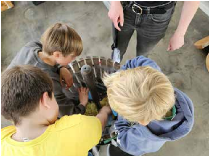
Die Freiwilligen helfen den Kindern beim Apfelsaft pressen

gieren, Neues ausprobieren und wertvolle Erfahrungen für ihre Zukunft sammeln möchten.